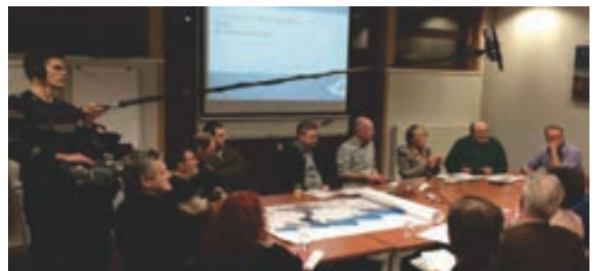
Het inspraakproces Plaatsbepalers aan de gang.

worden. In het voorjaar van 2018 moet de visie, die de basis vormt voor het ruimtelijk beleid in onze provincie, voor de komende jaren gestalte krijgen.