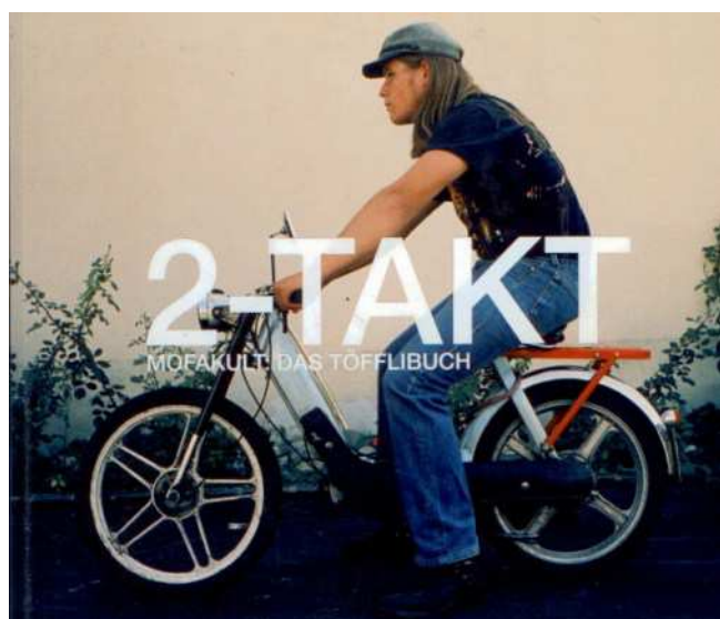
Foto's boven : de nabijheid van de Noordzee en de vele veeteeltbedrijven zijn een belangrijke bron van fijn stof in West-Vlaanderen (foto veestal : www.veeteelt.nl ). Foto hierboven : Brommertjes met 2-taktmotor zijn zeer vervuilend en eveneens een belangrijke bron van schadelijk fijn stof.

effecten daarbij nog versterken. Ook het aftakelen van de groenelementen die fijn stof afvangen maakt dat het gemakkelijker terug op warrelt ('resuspensie' geheten). Heel die troep zorgde in België alleen al (volgens Air quality in Europe-2015 report) voor 11.700 vroegtijdige sterftes in 2012. Daarnaast wordt fijn stof gelinkt aan allergieën, vroegtijdige geboortes, kanker, diabetes,... en heel veel koppijn. Want heel wat mensen trachten er aan te werken, terwijl heel wat andere mensen het beu zijn om alarmerende berichten te krijgen.