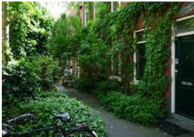
Foto's : Natuurbeheer levert soms wel wat brandhout op, een goedkope energiebron. Houtverbranding echter zorgt voor heel wat schadelijk fijn stof. Verstandig en zuinig omgaan met houtverbranding is dus onze boodschap. Voldoende groen helpt ook onze omgeving gezonder te maken.