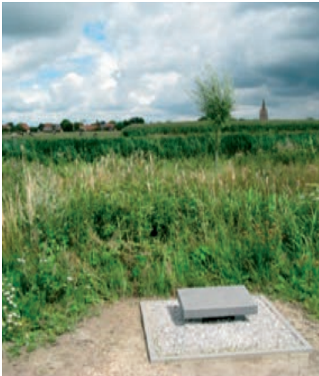
omzoomd met een meidoornhaag.

Na ruiling met een landbouwer bekam de gemeente een geschikt stuk grond voor de gedenkplaats. Een ontwerpplan van Buro Groen voor de inrichting ervan – opnieuw via het Interreg-IV subsidieproject - werd recent ook voorgelegd aan de milieuraad. Het wordt een natuurvriendelijke herdenkingsite : dolmen vanuit Wales met een Welshe draak te midden van knotwilgen en een panoramabord met zicht op de Steenbeekvallei en Passendale. Het geheel wordt