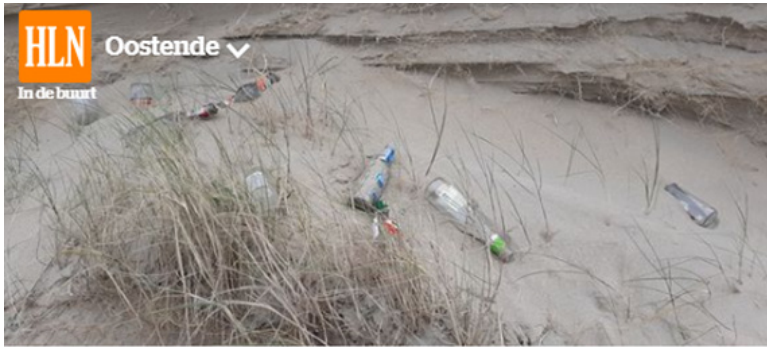
Er ligt meer afval dan gewoonlijk in de duinen aan de kust

West-Vlaamse Milieufederatie trekt aan de alarmbel: "Meer afval in de duinen door coronamaatregelen"