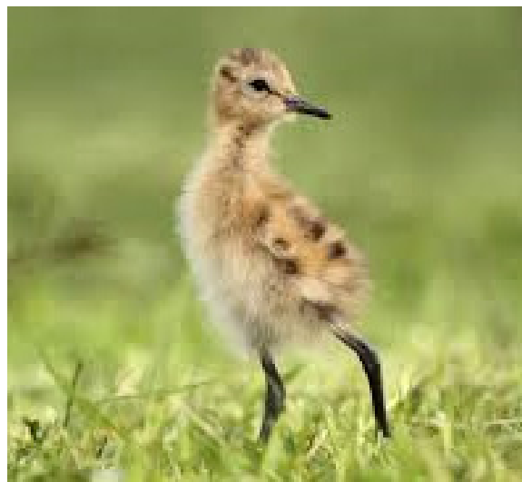
Foto: Grutto jong.

Er zijn zelfs al observaties waarbij broedvogels zich tijdens het broedseizoen verplaatsen richting de vernatte percelen.