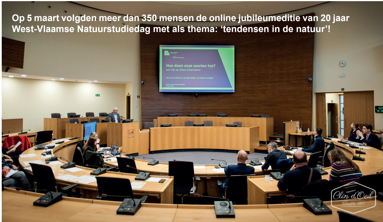
Op 5 maart volgden meer dan 350 mensen de online jubileumeditie van 20 jaar West-Vlaamse Natuurstudiedag met als thema: 'tendensen in de natuur'!