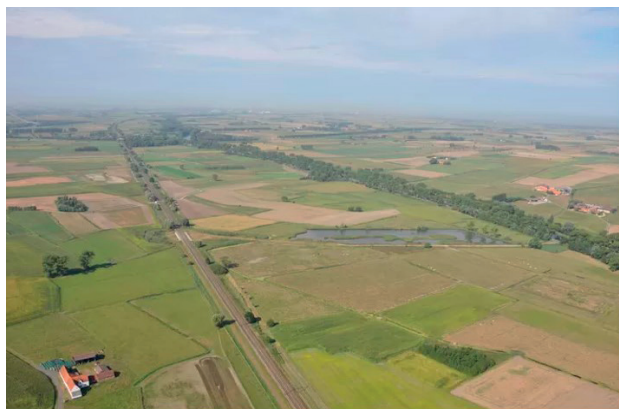
Het gebied Kwetshage wordt ingericht als rietmoeras en poldergrasland.