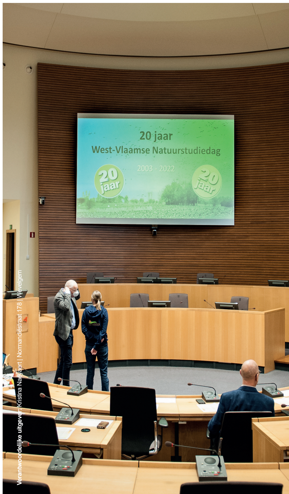
Verantwoordelijke uitgever: Kristina Naszaert | Normandiëstraat 178 | Wevelgem

Afgiftekantoor Kortrijk Mail | Erkenningsnummer P926193