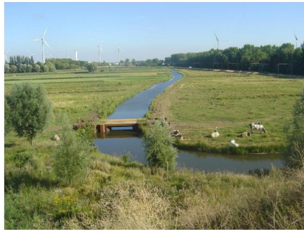
De Spie in Noord-Brugge wordt, als het van het provinciebestuur afhangt, een bedrijventerrein.