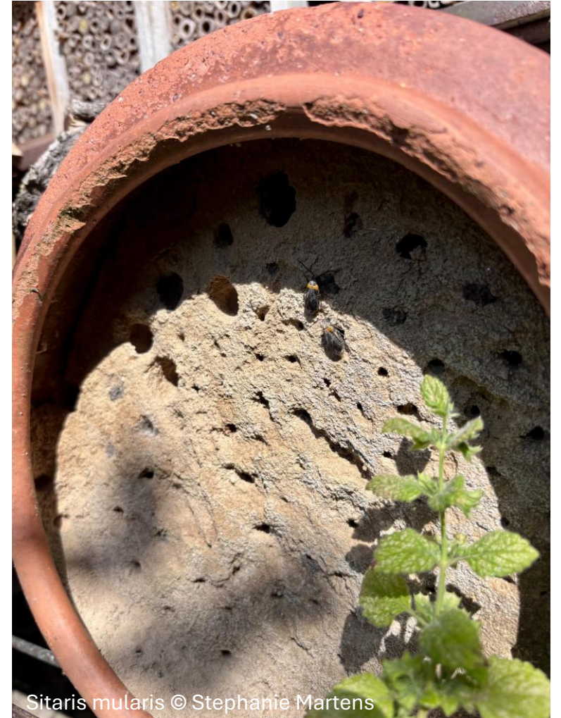
Sitaris mularis © Stephanie Martens