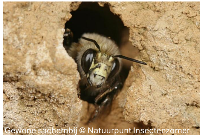
Gewone sachembij